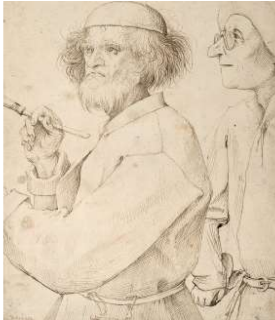
Bruegel d.Ä., Pieter. Maler und Käufer. Um 1565. Feder in Braun. Grafische Sammlung Albertina.

2019 jährt sich der Todestag von Pieter Bruegel dem Älteren (*um 1525/30, †1569) zum 450. Mal. Der aus Antwerpen stammende Maler „hat mit Scharfsinn, Eigenart und oft mit Humor das Leben niederländischer Bauern in zahlreichen Skizzen, Radierungen und Gemälden dargestellt.“ 1