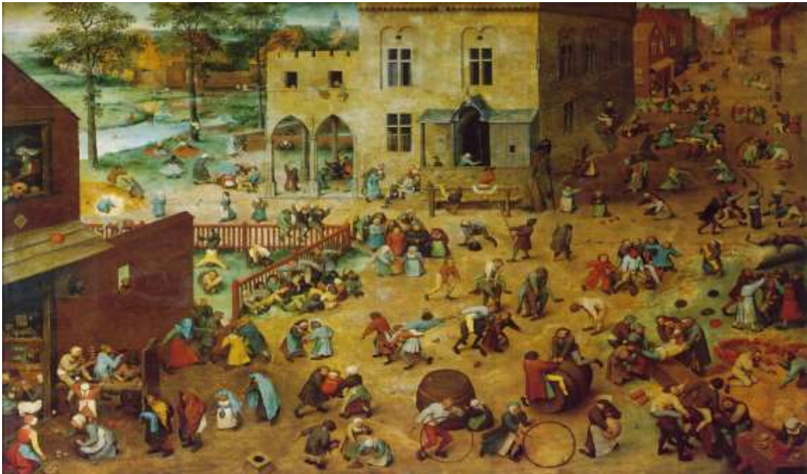
Bruegel d.Ä., Pieter. Kinderspiele . Um 1560. Öl auf Holz. Kunsthistorisches Museum Wien.

Kinderspiele , aus dem Jahr 1560, ist eines der knapp über vierzig noch erhaltenen Gemälde des Malers und hängt im Kunsthistorischen Museum Wien, das Pieter Bruegel dem Älteren noch bis zum 13. Jänner 2019 - die weltweit erste große monographische Ausstellung widmet.